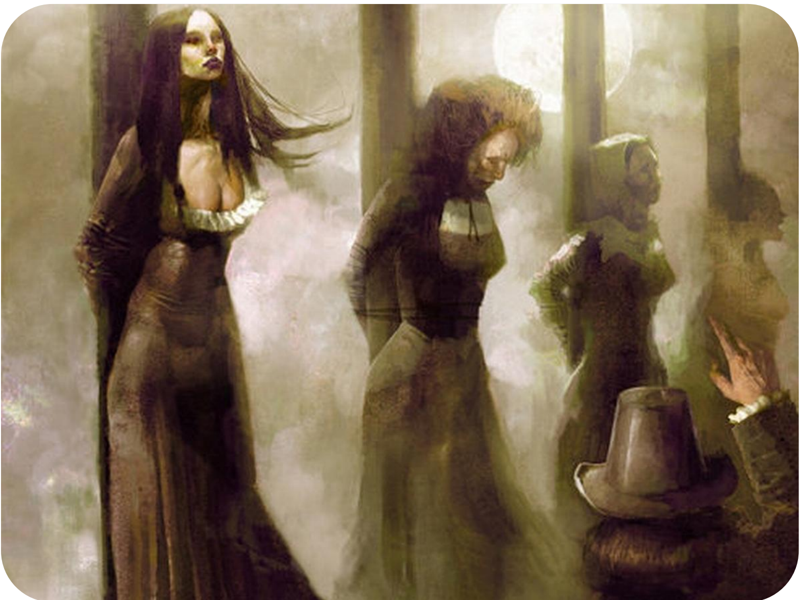
L'attimo prima del rogo

uccisi in quanto ritenuti capri espiatori, colpevoli di eventi negativi. A pensarci bene, dunque, le “streghe” di Parma non sono poi così distanti dal nostro oggi.