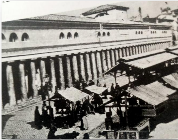
Il bellissimo porticato delle Beccherie in Piazza Ghiaia

Molte trasformazioni ha subito nei secoli, tra le più significative delle quali è quella relativa alla costruzione del magnifico edificio delle Beccherie. Maria Luigia duchessa di Parma affidò l'incarico all'architetto di corte Nicola Bettoli (1780-1845), che realizzò la costruzione in un solo anno nel 1838. In stile neoclassico, «era costituito da 50 colonne doriche in cui si aprivano 21 botteghe» 1 .