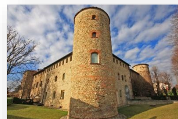
Castello di Gragnano