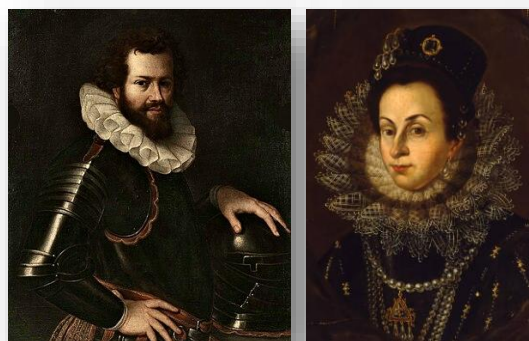
Ranuccio I Farnese e Margherita Aldobrandini

secondo alcuni, di stenti, dimenticate in quelle buie prigioni. Leggenda vuole che i loro fantasmi aleggino ancora fra quelle mura. Il duca Ranuccio I Farnese (quarto duca di Parma e Piacenza e quinto duca di Castro, figlio del condottiero Alessandro Farnese e di Maria d’Aviz), conosciuta l’avvenente quindicenne Claudia durante una festa in quel castello, ne fa la sua amante. La di lei madre Elena sente che la ghiotta opportunità di arricchirsi va colta e favorisce la relazione. Le due donne iniziano così a vivere a Palazzo Ducale a Parma e la corte deve trattarle come fossero nobildonne. Claudia ha due figli dal